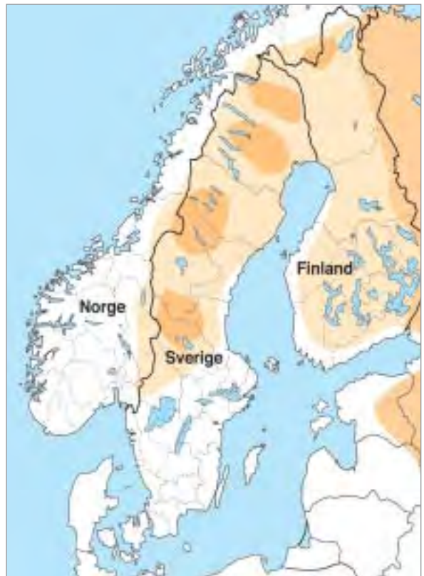
Bjørnens utbredelse i Norden og tilgrensende områder. Mørk oransje viser hvor binnene og forplantningen er konsentrert.

Spesielt i fire områder i Sverige forsvant bjørnen aldri helt. Det er fra disse ”kjerneområdene for reproduksjon” at bjørnestammen har ekspandert. Det er også her de fleste bjørnene finnes. Av de fire reproduksjonsområdene ligger to i Norrbottens län, ett i Jämtland/Västerbotten/Nord-Trøndelag og det sørligste i Härjedalen/Hälsingland/Dalarna. Utenfor disse områdene er det få hunndyr, men reproduksjonsområdene forandres og det innebærer at stadig flere bjørner påtreffes utenfor områdene. Det dreier seg oftest om yngre hannbjørner, som har gitt seg ut på lange vandringer for eventuelt å etablere seg i nye områder. Bjørnen ble utryddet som ynglende art i Norge på begynnelsen av 1900-tallet. Den er i dag reetablert også som ynglende gjennom innvandring fra nabolandene.