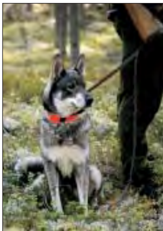
Hvis bjørnen følger etter en hund i skogen, kan det plutselig oppstå nærgående møte mellom menneske og bjørn.