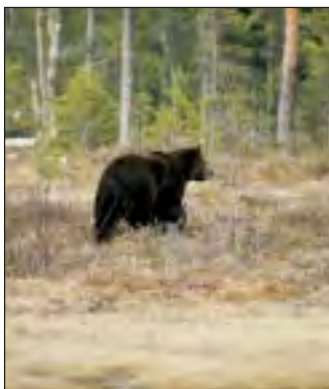
I fire av fem møter mellom bjørn og menneske unnviker bjørnen direkte så snart den er blitt oppmerksom på mennesket.

disse faktorene at bjørnen foretok skinnangrep eller oppførte seg truende. Nærværet av bjørnunger var den hyppigste årsaken til bjørnens aggressive atferd, deretter fulgte kadaver og til slutt hund.