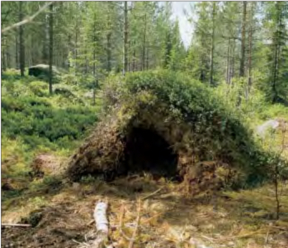
De fleste bjørner bygger hi i forlatte maurtuer.

Om man betrakter disse seks faktorene og vurderer dem med menneskets øye og fornuft, vil man nok finne dem rimelige. Det er rimelig å bli sint på den som skyter en kule i kroppen din, om han kommer for nær ungene dine og truer dem, om han vekker deg opp av skjønnetssøvnen, eller hisser en plagsomt bjeffende hund på deg. Det er rimelig. Det er rett og slett menneskelig.