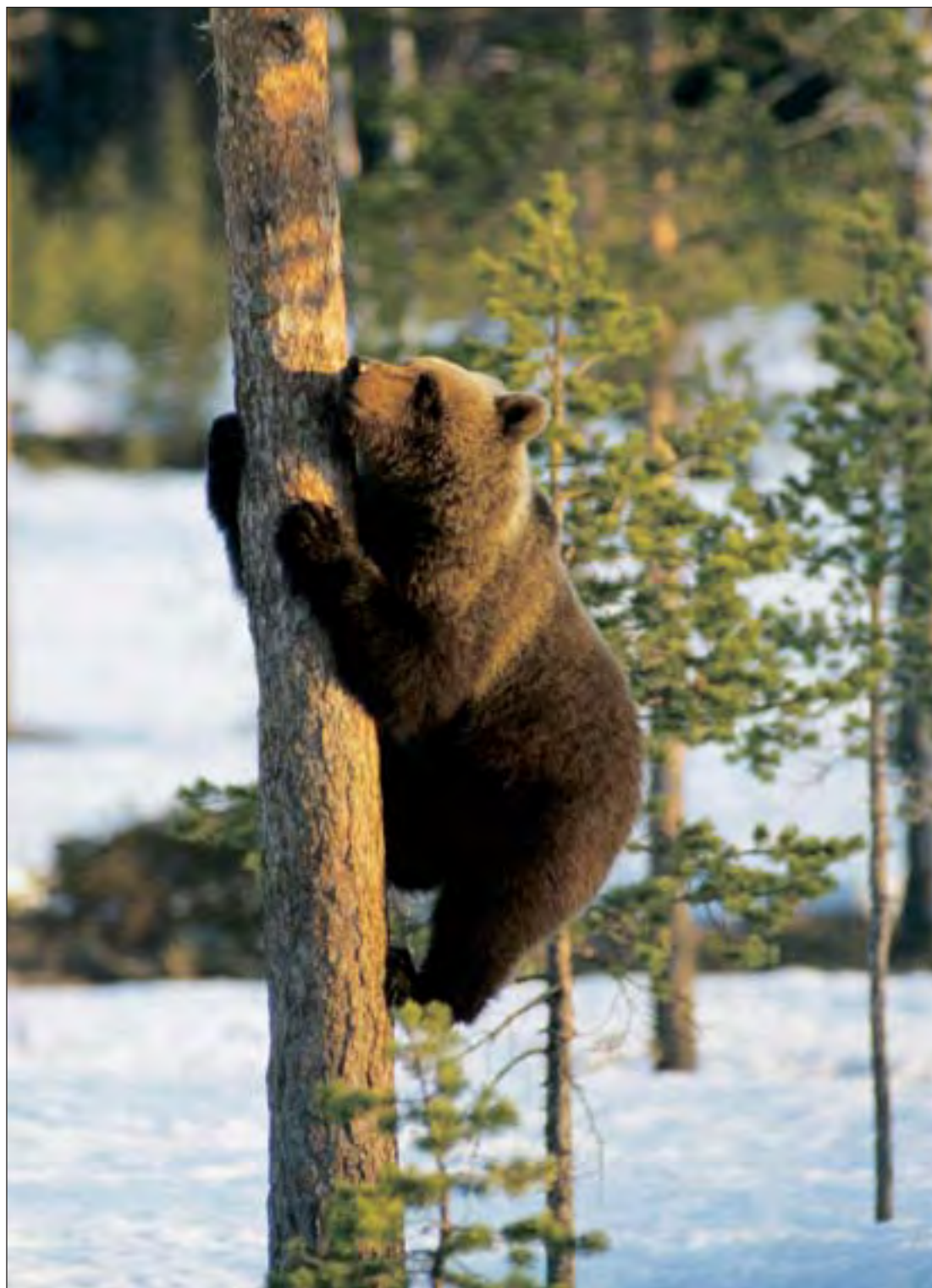
Også bjørner kan ta tilflukt i trær for å unnsnippe farer.