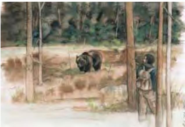
Bjørnen angriper ikke hvis den ikke provoseres.

La oss skifte perspektiv og gå ut fra bjørnens situasjon i de til sammen 75 tilfellene som ledet til at mennesker ble skadet eller drept. Da får man et ganske annet, tydelig bilde: I mer enn halvparten av tilfellene (38) var bjørnen beskutt