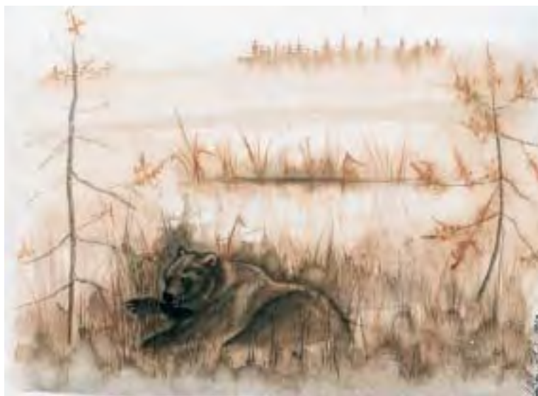
En skadet bjørn kan være en farlig bjørn.

I kjente bjørneområder kan det derfor være et generelt godt råd til hundeeiere å holde hunden i bånd, også i tider da det ikke er båndtvang.